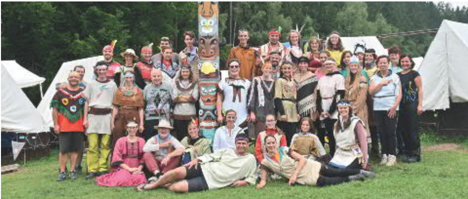
4. běh tábora