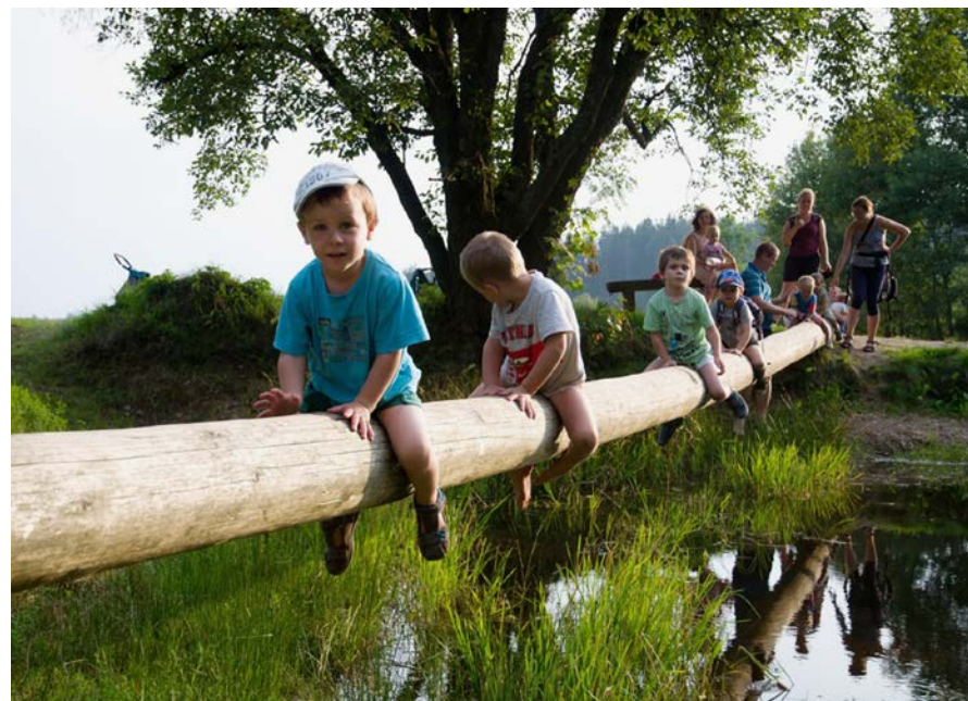
6. běh – tábor rodin