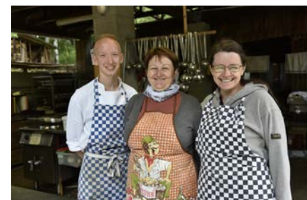
1. běh tábora