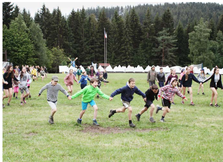
1. běh tábora