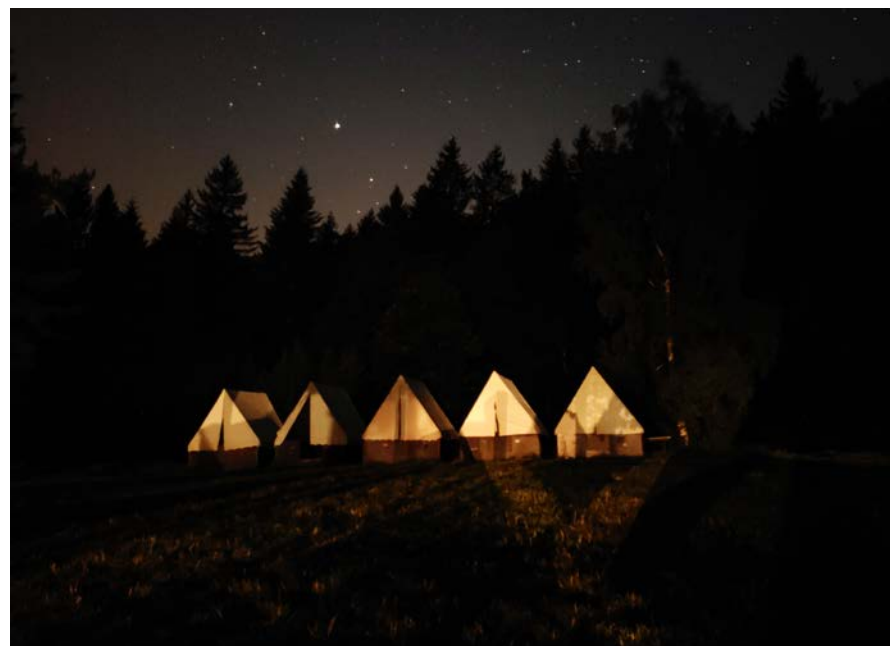
4. běh tábora