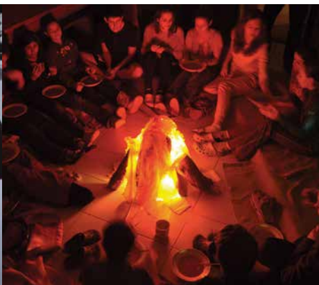
Pololetky | 21. 1. 2015 – 1. 2. 2015 | 22 účastníků