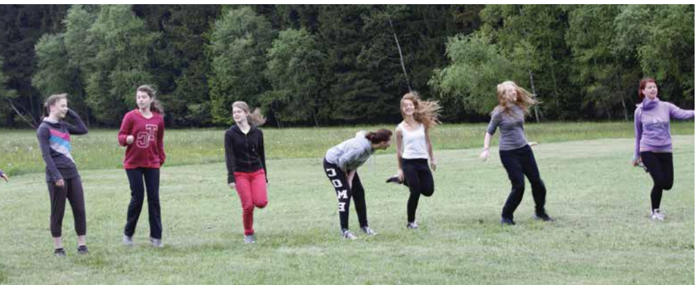
Rádcovské setkání | 22. 5. – 24. 5. 2015 | 49 účastníků