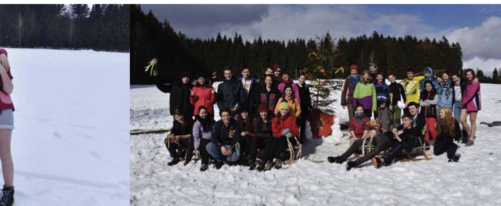
Velikonoční setkání | 1. 4. 2015 – 6. 4. 2015 | 50 účastníků