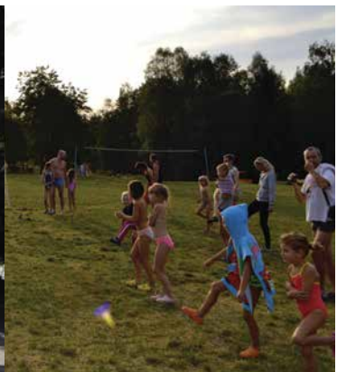
Rodiny 1 | 22. 8. 2015 – 26. 8. 2015