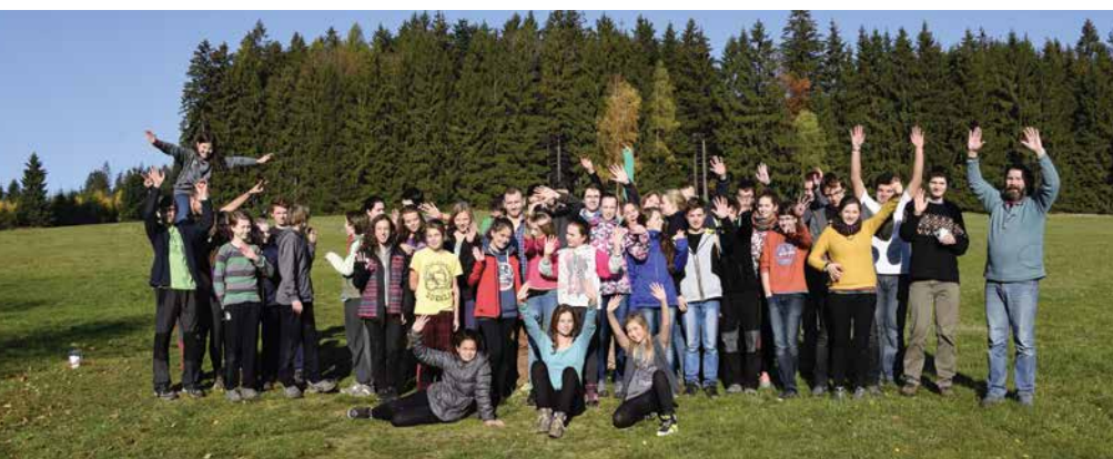
Podzimní listy 27. 10. 2015 – 31. 10. 2015 | 58 účastníků