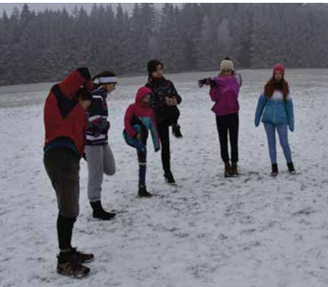
Vánoční setkání 28. 12. 2015 – 2. 1. 2016 | 50 účastníků