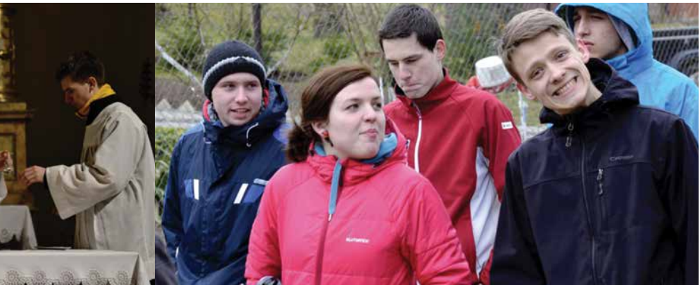
Duchovní obnova | 13. 3. 2015 – 15. 3. 2015 | 40 účastníků