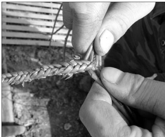
Pletení pomlázky v detailu