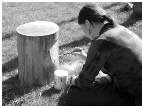
Jemná ženská ruka...

Je nám jasné, že každý z vás má možnost aktivně se podílet na bezpočtu ušlechtilých činností. Naše sdružení nemá žádného stálého zaměstnance; co si uděláme, to máme, co neuděláme, to prostě není. Nikdo z těch, kdo se dětem věnují, nepobírá od sdružení plat. Veškeré pedagogické, duchovní, zdravotní a technické zajištění na