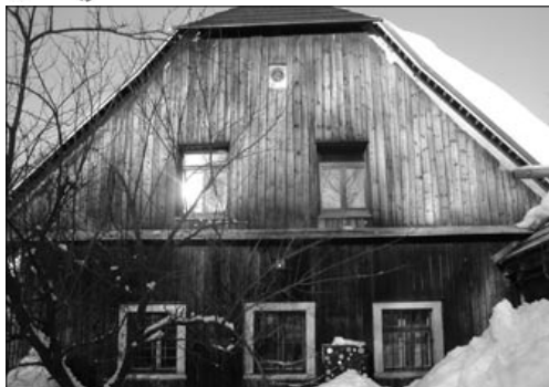
Tento pohled je již minulostí

ji chtějí prohlubovat, aby i ostatní mohli pít. Nebo ve smyslu exupéryovského Malého prince vzít děti za ruku a vést pomalu ke studánce.