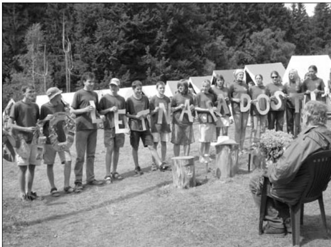
Tábor v nejlepších letech