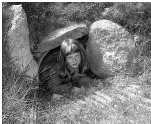
Princezna v Dračí sluji

pergamenu. Ohlídlá jsem se za sebe a zamrazilo mi. Zdálo se mi, že za mnou stojí postava v bílém hábitu s napřaženým mečem. Už jsem se tam radši ani nedívala. A vzápětí jsem zaslechla křik: Holky, holky, kde jste, kam jste se schovaly? Napřed jsem myslela, že to ječí Sára z legrace, ale když se do křiku začal mísit pláč, bylo mi jasné, že to legrace není. Plakala malá Terezka. Doběhla jsem k ní a ona se mě chytla za ruku a že nemám chodit pryč. V dálce se objevil člověk, s kápí a brašnou. Přišel až k nám a řekl, že se máme oddělit. Pak řekl, že to, co nám teď dá, je strašně důležité a ať nás ani nenapadne to ztratit. Podle hlasu jsem poznala Silvu. Dala nám kousek papíru, na kterém bylo pár nedopsaných slov. Silva v hábitu pomalu odcházela k dalším stanovištím.