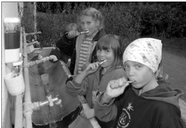
S úsměvem jde i čištění zubů líp

Asi po dvaceti minutách rychlé chůze se postupně začala rozpouštět neproniknutelná clona přípravků typu Antihmyz a pomalu jsme začali vidět na cestu. I nenasytné mouchy to vzdaly a vydaly se šikem zpět směr tábořiště. Právě v tomto okamžiku se mladší děvčata blížila k místu, kde se jejich cesta měla rozdělit. Hrozivé ticho konečně pomalu začalo smývat neutuchající optimismus a děvčátka se začínala bát. V místních lesích se totiž usídlili loupežníci, kteří se rozhodli znepříjemnit cestu počestným poutníkům. To bychom nebyli táborníci z Radosti, abychom se nenabídli, že pomůžeme poutníkům klidně projít toto