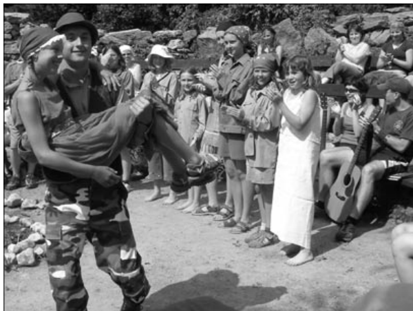
Karkulka na jedničce byla uměleckým zážitkem