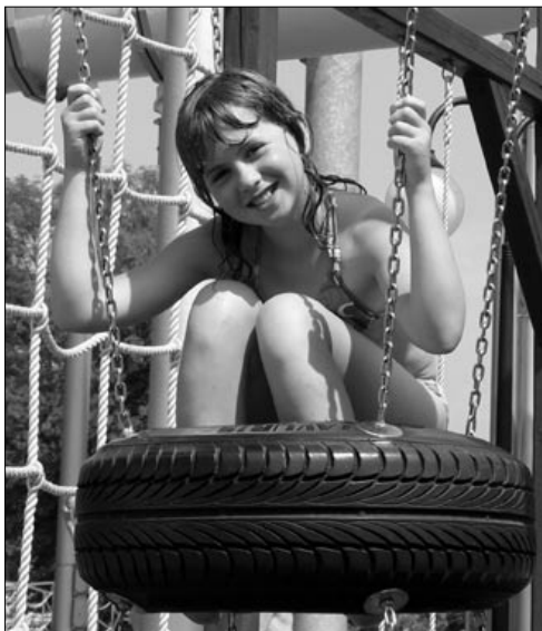
Děvče v jednom kole

Ten den nebyla kondička! A překvapivě to nikomu nevadilo. Místo ní jsme mohli jít do sprch. Potom jsme se pomodlili společně růženec. Po večeři se sešli všichni táborníci, kteří chtěli předvést své umění na klavírním koncertu. Slyšeli