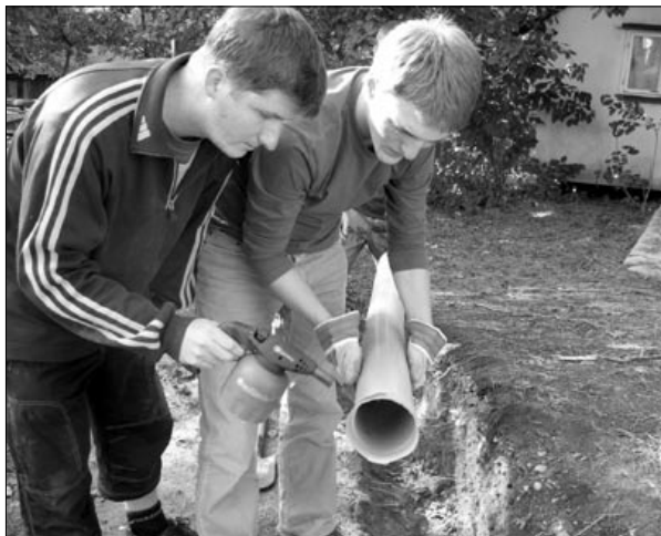
Kluci v akci

Pokud se rozhodnete přijet pomoci, ohlaste nám svou účast předem, a to nejlépe alespoň týden před konáním pracovního setkání. Usnadníte nám