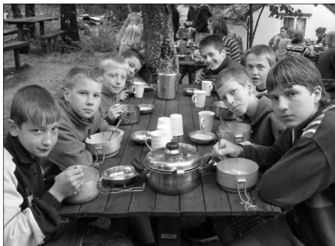
Kluci jako buci