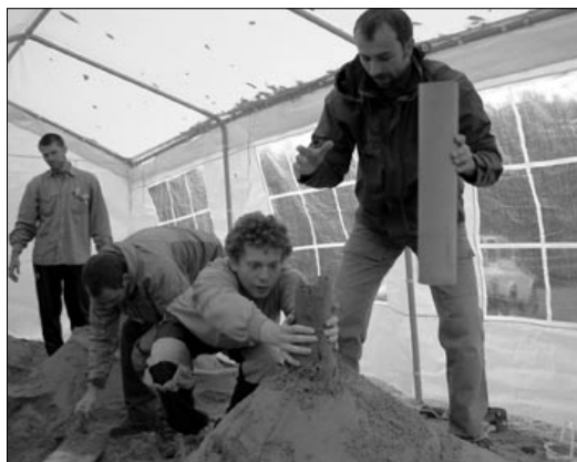
Kůň je jednou hříbětem...