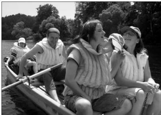
Pohoda na lodičkách

vydali se na přehradu zajezdit. My jsme pluly se Sokolem. Bylo to docela zajímavé. Ale nic netrvá věčně, a tak jsme i my musely vrátit loď a vydat se zpět do tábora. Cestou zpět jsme složily básničku o výletě. Myslím, že se nám docela povedla. A ještě jsme se pomodlily růženec na zpáteční cestě. V táboře nás přivítali s otevřenou náručí, a tak jsme rády vyprávěly. Nesmím zapomenout, že na večeři byla pizza. Byl to opravdu pěkný slunečný výlet a den.