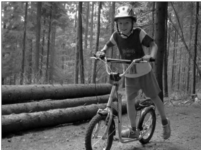
S GPS na (kilo)metr přesně!