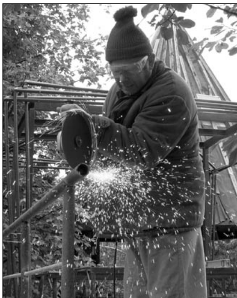
Byla nebyla, ale spíš byla, než nebyla, jedna flexka

Pokud přijedete na celou dobu konání setkání některým z hromadných dopravních prostředků, můžeme vám cestovné proplatit. Od vás k tomu potřebujeme jízdenky nalepené na listu papíru formátu A4, na který napíšete název nástupní a výstupní stanice a jména a příjmení všech cestujících, kteří s vámi přijeli. Pokud přijedete autem, ve kterém přijedou nejméně tři osoby schopné práce, je k proplacení benzínu potřeba vyplněný cestovní příkaz a kopie technického průkazu vozidla.