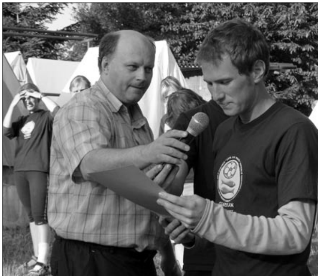
Mikrofon na tábor patří!

Kolem se toč – v neděli v 19.00, repríza v pon-