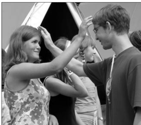
Někdy na konci tábora tečou i slzy

Z členství vyplývají rozličné výhody, například snížení cen při pobytových akcích, účast na duchovním společenství Radosti a na dalších hmotných a duchovních dobrech. Sdružení informuje členy o své činnosti prostřednictvím zpravodaje.