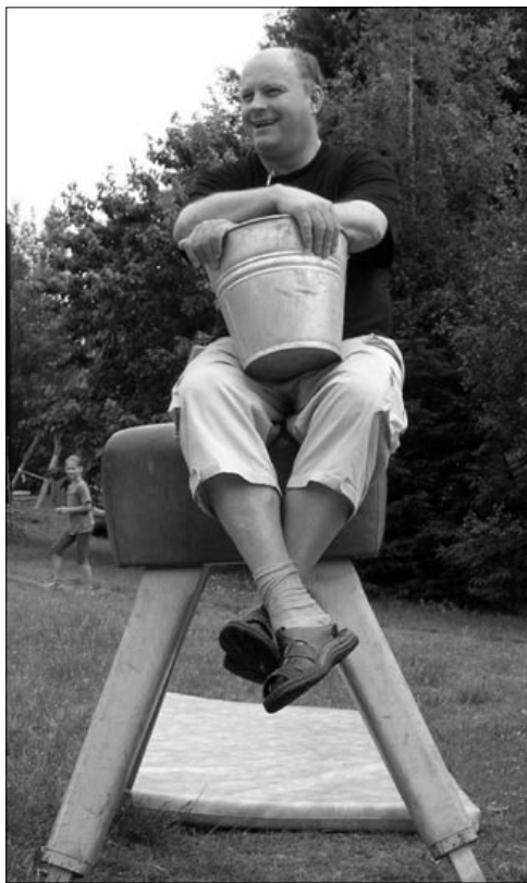
Otec Martin nepřeskočil, ale vyskočil!