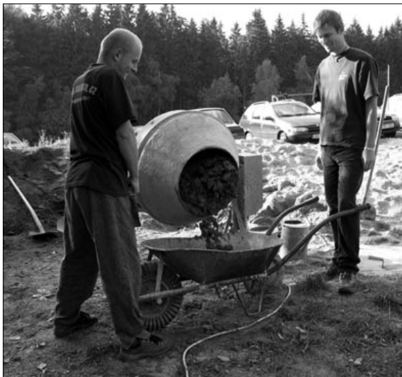
Kdo nemíchá s námi, míchá proti nám

Za podpory MŠMT, Jihomoravského kraje, Magistrátu města Brna a dalších