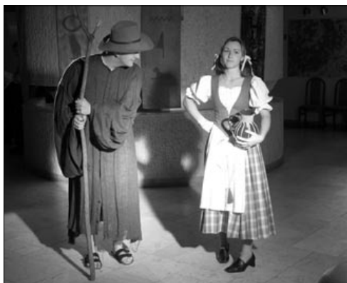
Z pohádky do pohádky – ples na Vyhlídce