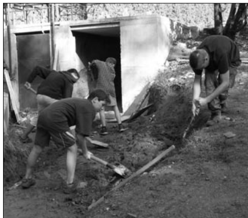
Můj bunkr, můj hrad.