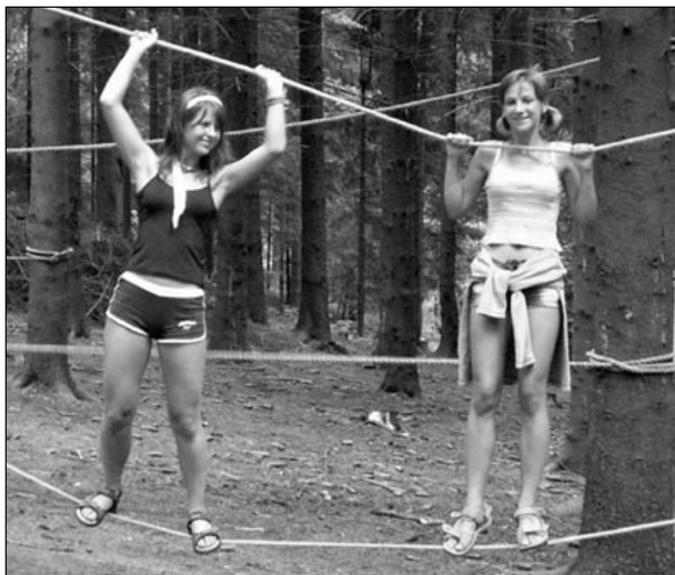
Lanové aktivity v Mláží