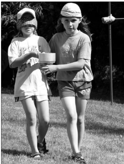
Důvěra a zodpovědnost

Postupně mi ale začalo docházet, že má nevidomost není nějaká nešťastná náhoda, ale že je to Bohem zamýšlené, a tak i něco radostného. Na Americe cítím velké množství lásky, která se projevuje krásnými skutky. Kdybych viděla, asi bych si to tolik neuvědomovala, protože bych nepotřebovala tu laskavou pomoc milých radostňáků. Byla to pro mě velká zkušenost – mít v patronátu šestnáct děvčátek, mít zodpovědnost za jejich prožívání, částečně i podle možnosti něco věst a dohlížet na to (například při kritěrku jsem