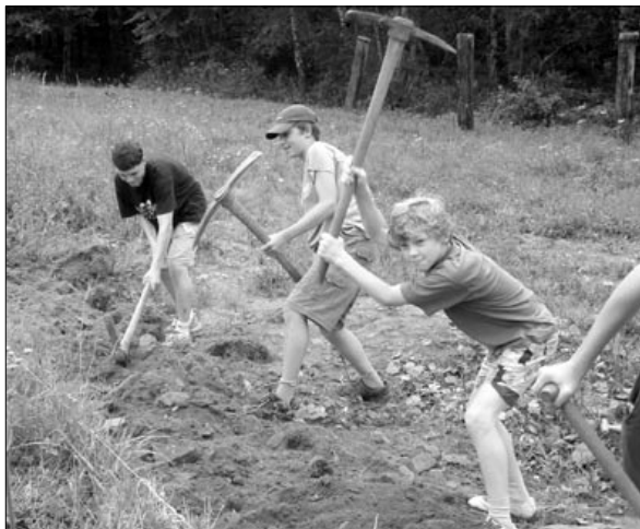
...a mužná síla

Základní informace o táborech jsou uvedeny na „infolistech“ jednotlivých běhů, které zasiláme spolu s přihláškou. Přihlášku je třeba nechat potvrdit lékařem. Reklamace a dotazy ohledně plateb za pobyt, informace o přijetí dítěte na tábor a změny běhů se vyřizují písemně na výše uvedené adrese otce Tiška. Podrobnosti o konání běhů Tábora rodin budou rodinám, které již projevily nebo projeví zájem, upřesněny. Případné informace lze získat telefonicky nebo mailem od manželů Tomáše a Ajky Holíkových .