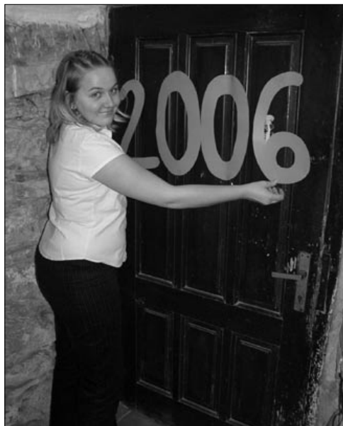
Když byl rok 2006 za dveřmi...

Ještě první večer byli vyhlášeni členovci, kteří měli sestavit vlastní družinky, každý z nich zastupoval jeden ze světadílů: Ameriku, Evropu, Asii, Afriku a Austrálii. Nejdříve jsem byla Aus-