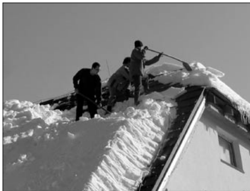
Boj se sněhovou nadílkou

rybičky, rybáři jedou“, jen se své oběti nestačí pouze dotknout, musíte ji zvednout do vzduchu a zařvat: „Raz, dva, tři, buldok“. Strašlivý buldok Harry se dokonale vžil do své role a za děsivého řevu házel do vzduchu jednu oběť za druhou. Hra se proměnila ve velkou bitku, na jejímž konci zbyly tři ustrašené duše. Ty se navzájem objaly a jen tiše doufaly, že vyvážnou se zdravou kůží. Avšak i přes jejich snahu bylo buldoků přespříliš a zvedli všechny tři naráz. Jejich jedinou útechem však mohlo být, že zůstaly spolu. Poté co jsme se proměnili zpět v kamarády, šli jsme se společně ohřát a napít horkého čaje.