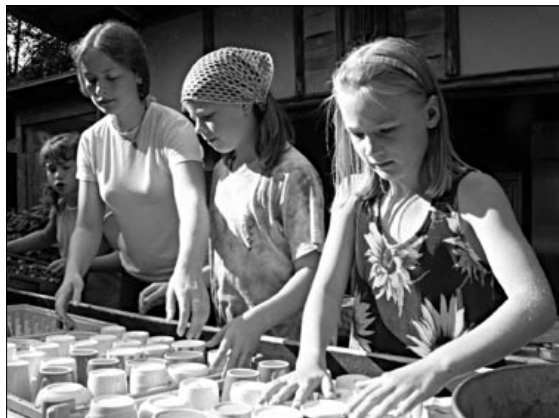
Práce v kuchyni

Přesto se toho stihlo tolik... Při pohledu z ptačí perspektivy musela Amerika vypadat jako mraveniště plné pilných mravenečků. Kluci a tatínkové