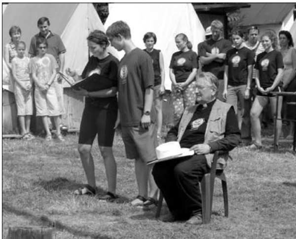
Závěrečný nástup na třetím běhu

A pak z davu zaznělo: „Už jedou,“ a všechno najednou ztichlo. Přiznám se, že v té chvíli by se ve mně ani krve nedořežal a hlavou mi jen proběhlo: „Jak to asi dopadne.“ Najednou všechno nabralo takový spád, že jsem se ani nenadál a už jsme stáli společně s otcem biskupem na uvítacím nástupu – zkrátka, tu půlhodinu stále někde hledám, možná ji někdo vymazal. V tento slavnostní den by si každý mohl zpívat známou píseň „Až bude na nás vylit Duch Svätý a z pouště bude sad...“ a k tomu by měl tak trochu dvakrát pravdu, protože nejen Duch Svätý se vylil, ale i nebe se „trošičku“ vylilo a všechno bylo jinak, než bylo v plánu. Mši svatou jsme netradičně prožili pod pěti altány, které během chvílky vyrostly na louce. Hosté