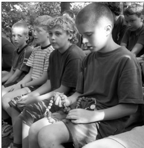
Růženec na táboře

Pro brněnské setkávání mladých starších 16 let ze Střediska Radost slouží i nadále prostory Studentského centra na ulici Koží 8. Sraz je každé úterý v 19 hodin, zvoni se na zvonek SC.