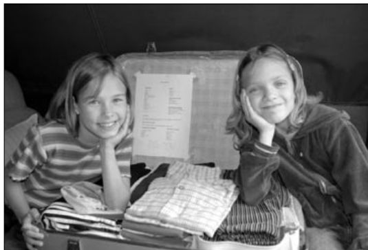
Můj kufr a já

Tábory jsou organizovány Střediskem Radost na samotě Amerika v obci Klášterec nad Orlicí. Jedná se o stanový tábor v Chráněné krajinné oblasti Orlické hory. Táborová základna v současné době poskytuje standardní komfort ubytování i zázemí pro všechny táborové aktivity.