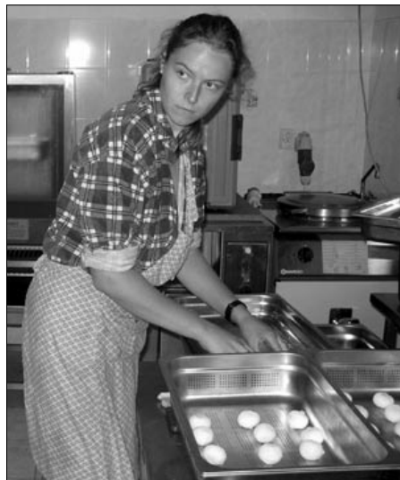
Konvektomat – půl oběda