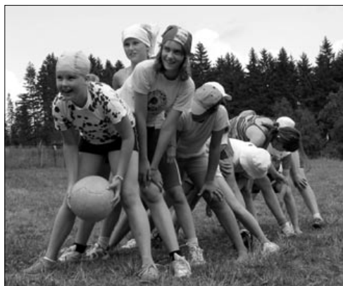
Každé odpoledne sportujeme