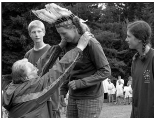
Vítězství v soutěži o členku indiánského náčelníka