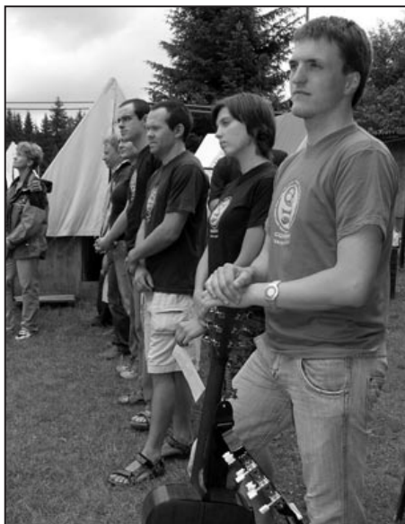
Poznavací znamení vedoucího: emblém GUARDIAN na hrudi