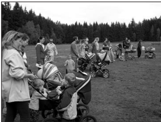
Část družiny na nástup prostě přivezou

Tentokrát nám dráček Senzík pomáhal odhalovat krásu a bohatost našich smyslů. Kromě pěti těch nejznámějších – zraku chuti, čichu, sluchu a hmatu – jsme objevovali mnoho dalších – smysl pro krásu, pro orientaci, pro pořádek, pro odpovědnost, pro vymyšlení lumpačin... Děti si