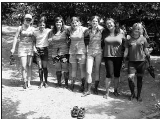
Exkluzivní bahenní „podkolenky“

A tak jsme se všichni oblékli do horšího oblečení a horších bot a hurá na hru. Smysl této hry spočíval v tom, že každý dostal papírek (zelený nebo červený), kterým prokazoval svoji totožnost u hodných indiánů, kteří nám dávali zvířata pro královnu Isabelu Kastilskou, od každého druhu musel být pár. Byli tu však ještě zlí indiáni, kteří nás chytali a brali nám ulovená zvířata a s nimi i „průkaz totožnosti“, pro který jsme si potom museli na hlídku. Byl tu i obchodník, který za pět zvířat vyměnil jedno, které jsme potřebovali. Po zaznění klaksonu jsme dali všechna zvířata, i ta nespárovaná, do obálky a začala druhá část naší hry.