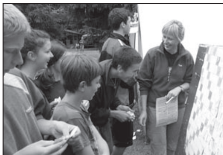
Určitě velice zajímavá hra

I nyní si z fotek můžete udělat představu o dnech a týdnech tábora, jak je zaznamenali vedoucí i sami táborníci.