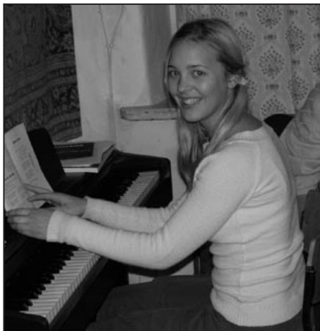
Elektrické piano v Sednici pořizené díky dotaci