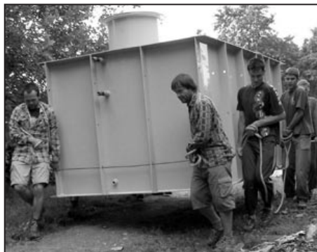
Táborníci po boku vedoucích při budování vodojemu

Tato etapa rekonstrukce v sobě zahrnovala také zřízení nového vodojemu. Jáma pro osazení zakoupené cisterny byla hloubena již na jaře, hlavní díl prací však odvedli vedoucí a někteří táborníci na táboře. Bylo třeba připravit betonové pouzdro, usadit vodojem, napojit na vodovod, zalít betonem a opatřit shora překlady. Díky závěrečným terénním úpravám dnes značí místo výkopu jen úhledný poklop. Naleznete jej nad chatkami (Státy) na úrovni horních venkovních jídelních stolů.