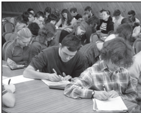
Vedení se pravidelně školí