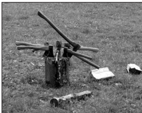
Výzva pro ochotné ruce

Naše stálé spolupracovníky a pomocníky pravidelně informujeme o plánovaných pracovních setkáních převážně elektronicky. Není však v našich silách obsáhnout všechny nové ochotné pomocníky. Rádi vás na Americe přivítáme. Přijďte a přijďte se podívat na místa, kde, dá-li Pán, budou vaši blízcí prožívat kouzelné dny tábora.