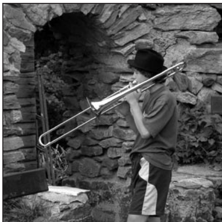
O muzikanty není na Americe nouze

Středisko Radost uspořádalo společně se skupinou studentů Lékařské fakulty Masarykovy univerzity v Brně Mikulášskou nadílku pro děti z brněnské Dětské nemocnice. Účastníci akce navštívili děti z onkologické a interní kliniky. Každé dítě bylo obdarováno balíčkem a menší