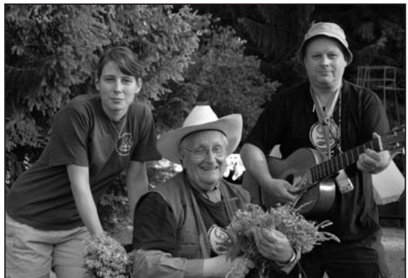
Bratři a sestra v triku