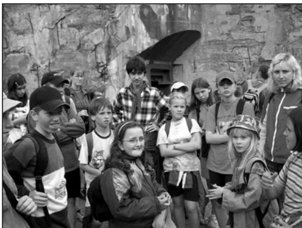
Ná táborovém výletě