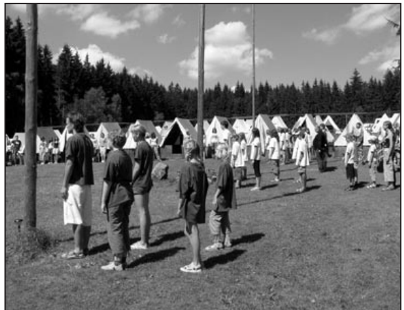
Při ranním nástupu na táboře vztyčujeme státní, evropskou a radost'áckou vlajku

Základní informace o táborech jsou uvedeny na „infolistech“ jednotlivých běhů, které zasíláme v souvislosti s vyřizováním přihlášky. Před nástupem na táboře zasíláme také tzv. nástupní list.