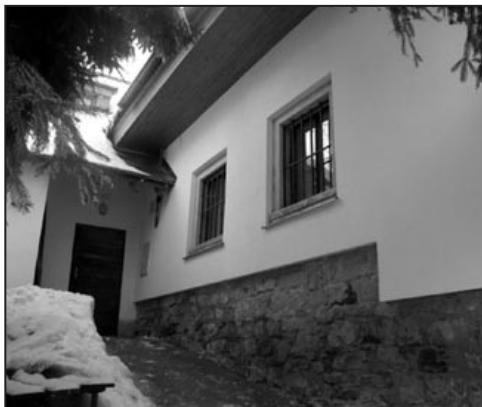
Vchod do chalupy v lednu 2008