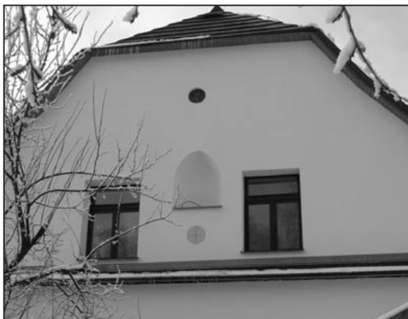
Východní strana chalupy v lednu 2008