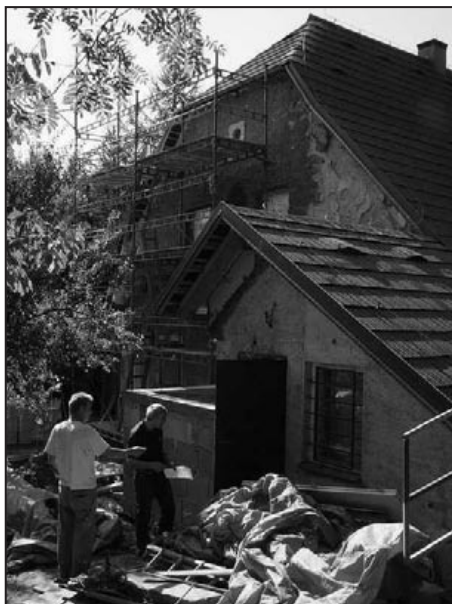
Stavební práce v plném proudu

Všechna okna a zakončení střech dostala nové oplechování – podle umístění byly tyto práce provedeny v mědi, titanu a v nerez.