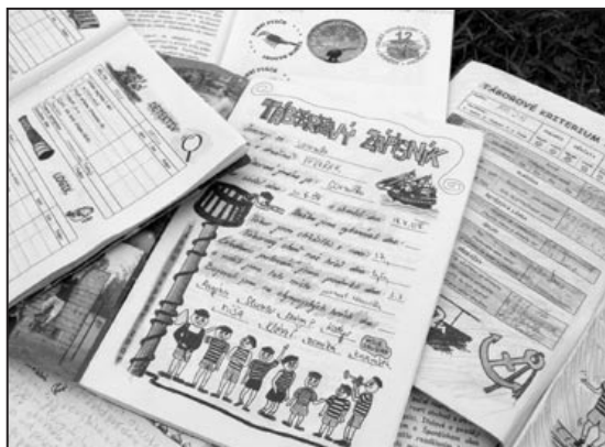
Zápisník pro táborníky býval Robinovou parketou

dalších výhod, například rozšířeného přístupu k informacím. Zároveň nám tím umožníte kontaktovat vás.