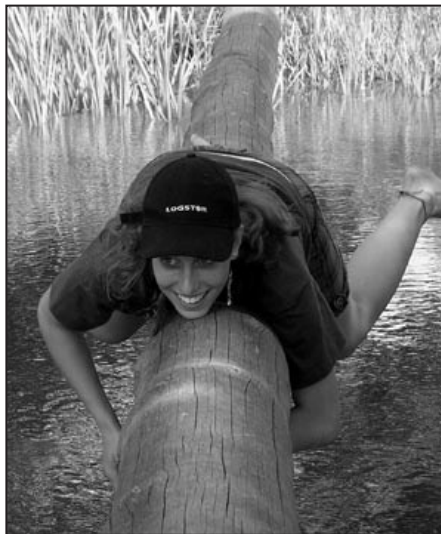
Přes vodní kladinu s úsměvem

půjde. Proč se neuvádí. Pak se dělíme do skupin na kluky, holky a na mladší a starší. Následuje zahřívací běh, nejlépe po slalomku, poté je rozcvička (která je pro mnohé naprosto nezvládnutelná) a pak tzv. první blok. Tam máme pokaždé jiný program. Někdy provozujeme krkolamy na hrazdě, kladině a kruzích, běháme štafetu, házíme diskem a koulí, jindy hrajeme nějaké menší hry anebo se plazíme po horolezecké stěně.