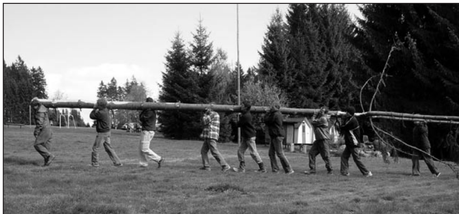
Když vítr shodí rozsochu u táborového kruhu...

Nevyužijete-li internetové formuláře , pošlete přihlášku na: Středisko Radost, o. s. Mrkosova 20, 615 00 Brno nebo setkani@taborradost.cz