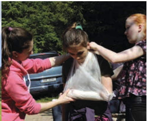
Rádčovské setkání na Americe 20.–22. 5.