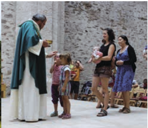
Rodinky 20.–25. 8., 25.–30. 8., 31. 8.–4. 9., 4.–9. 9.