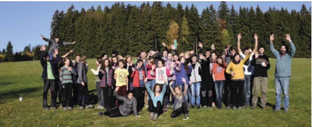
Skřížení letního vybavení na Americe 29. 9. -2. 10.