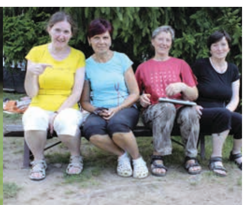
2. běh 16.–30. 7.