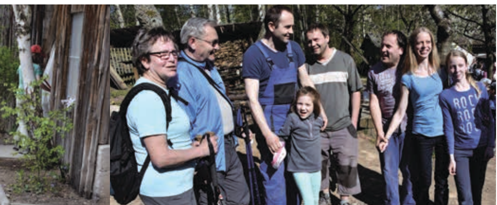
Květnové brigády na Americe 29. 4.–1. 5. a 6.–8. 5.