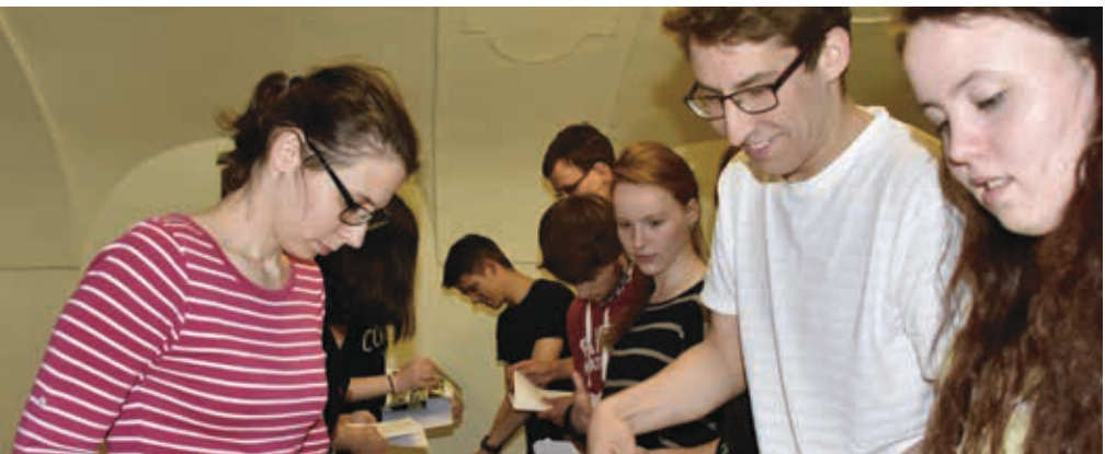
Školení vedoucích 8.–10. 4.