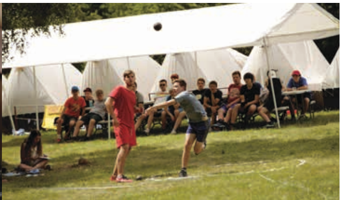
1. běh 2.-16. 7.