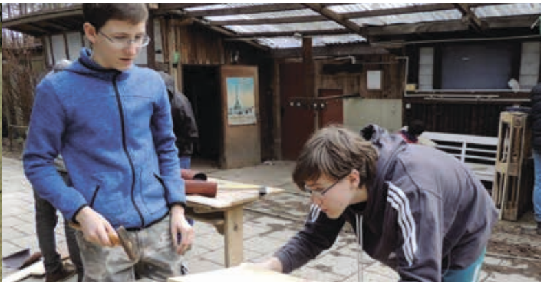
Velikonoční duchovní obnova 23.–28. 3.