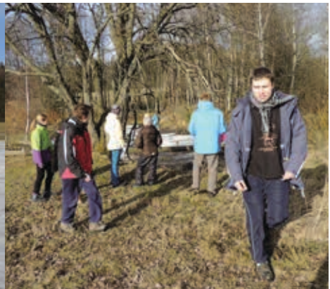
Pololetky 2016 28.–31. 1.