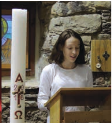
Vánoční setkání na Americe 28. 12. 2016 – 2. 1. 2017