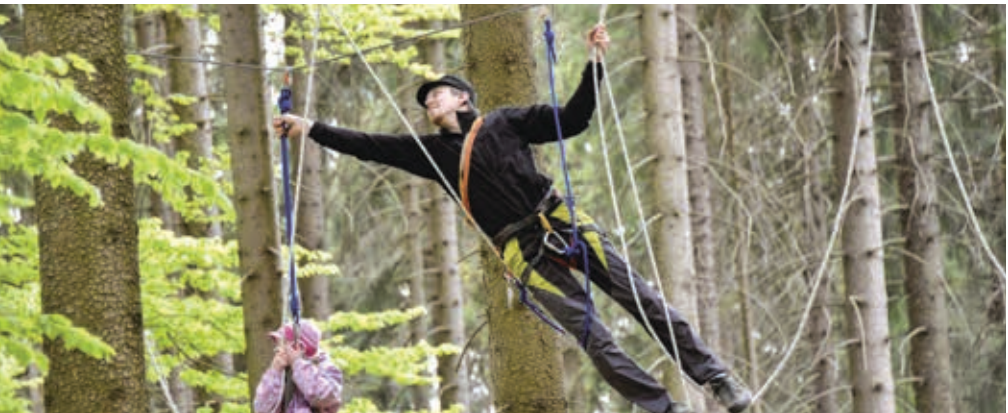
Den otevřených dveří na Americe 8. 5.