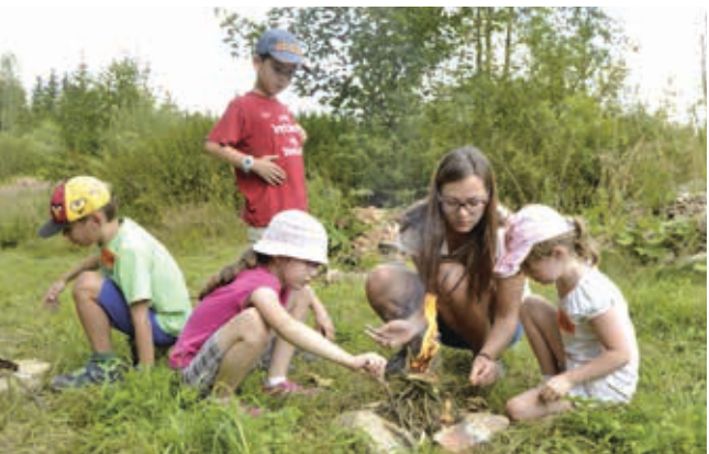
Jitřenka 13.-20. 8.