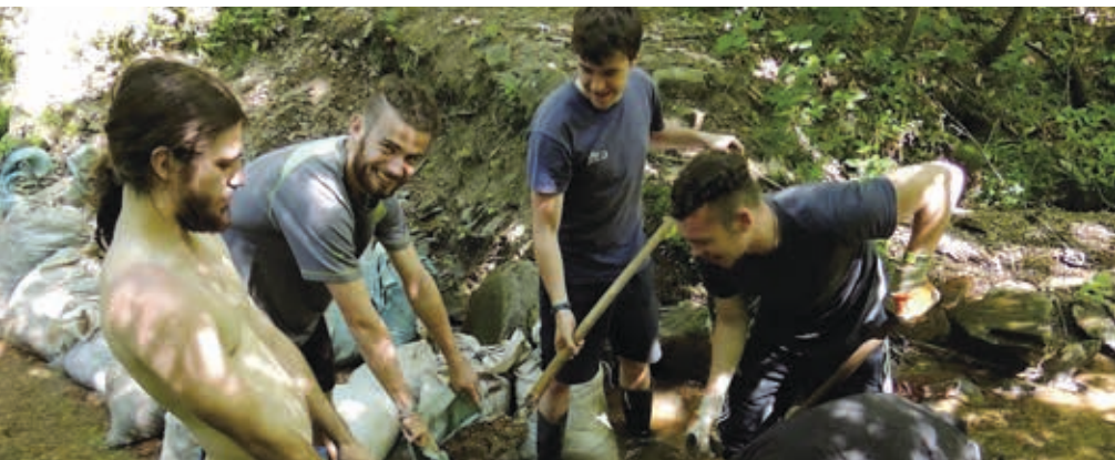
Stávečky na Americe 24. 6.– 2. 7.