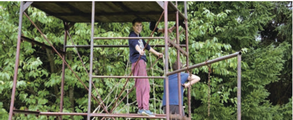
Podzimní listí na Americe 14.–16. 10. Poslední běh, 25.–29. 10.