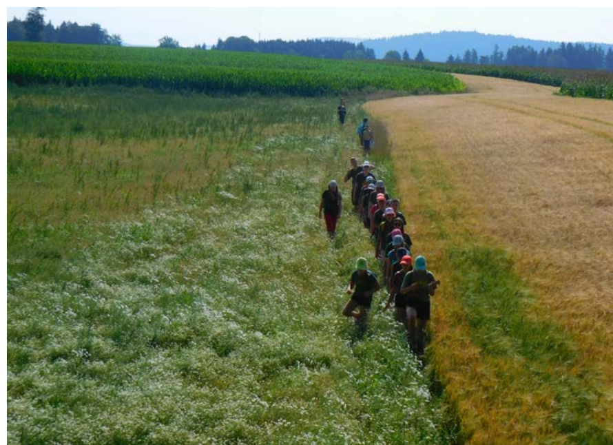
2. běh tábora