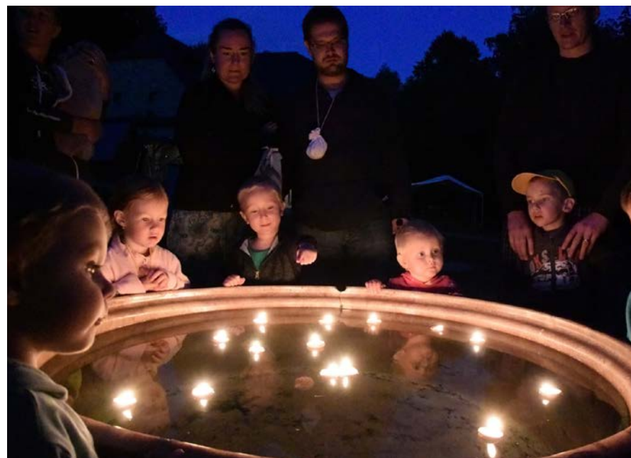
7. běh – tábor rodin