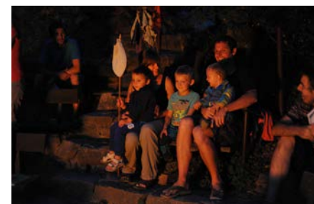
5. běh – tábor rodin